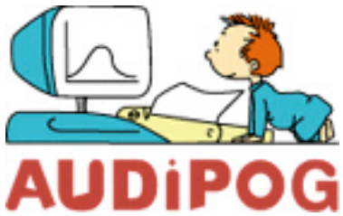
Plate-forme de communication